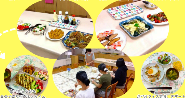
食べながらの自分でも盛り付けられるスタイル

焼きそば、サラダ、フライ、味噌汁、杏仁豆腐 焼酎、ひめ竹&ももこの煮物、肉団子、味噌汁