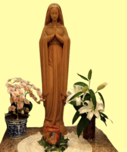
マリア様 たいまいー!

寮では、授業で学ぶことのできない、大切な事が学べます。 同じ年代や、他の学年の寮生と一緒に生活し 多文化共生の方法を学びます。異なる文化や習慣を お互いに認め、理解し、助け合うことが大切です。 一生の友達に出会える事も、大きな魅力です。